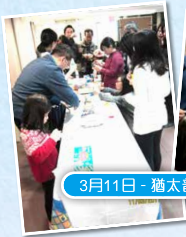
3月11日 - 猶太普珥節救贖慶典