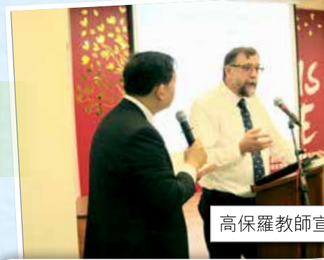
3月25日 - 以色列及聖經講座： 「聖經預言中的現代以色列國復興」 「以色列終的終極復興」