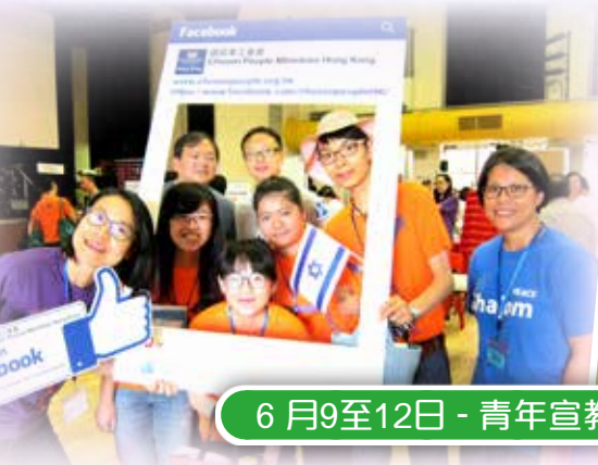
6月9至12日 - 青年宣教大會