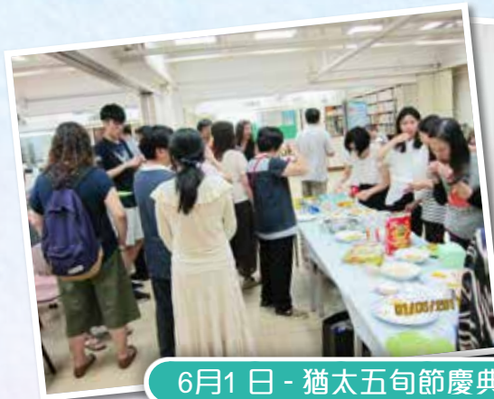
接觸居港及來港 旅遊的猶太人