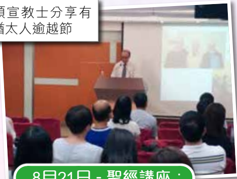
哥頓宣教士分享有 關猶太人逾越節