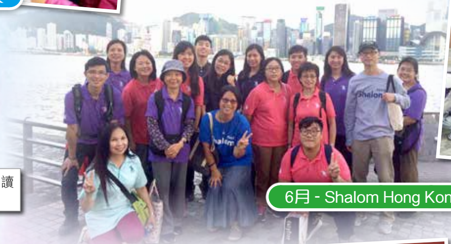
6月 - Shalom Hong Kong