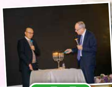
12月10日 - 十周年感恩晚宴暨光明節慶典