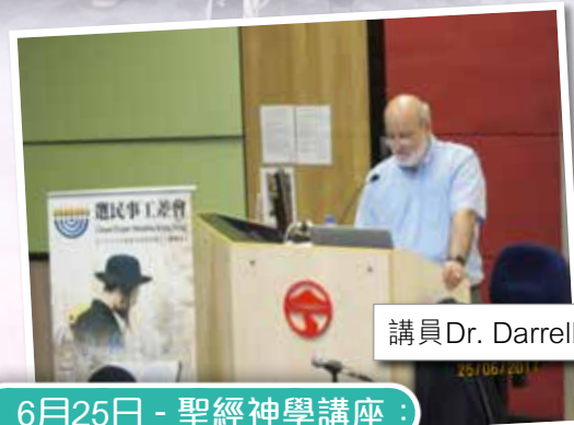
6月25日 - 聖經神學講座： 「新基督教錫安主義」及 「從對觀福音書看逾越節中的彌賽亞」