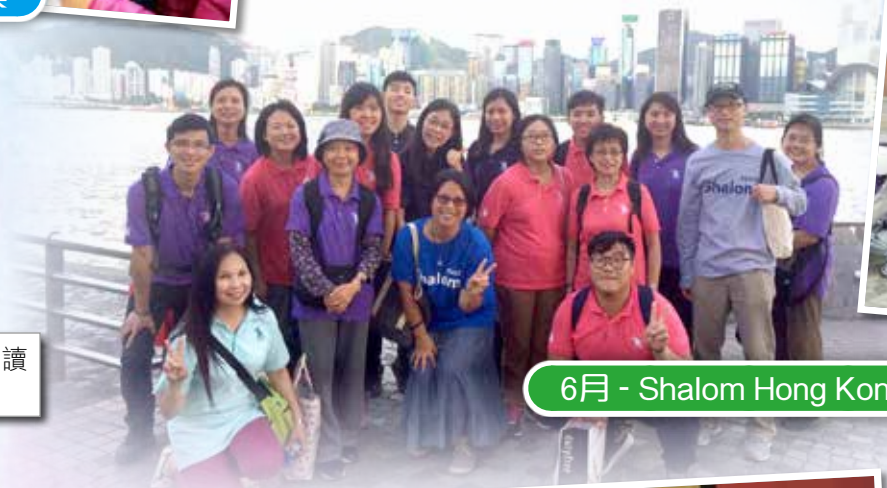
6月 - Shalom Hong Kong