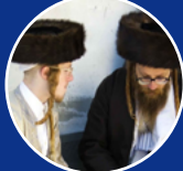
極端正統派猶太人 （哈雷迪）