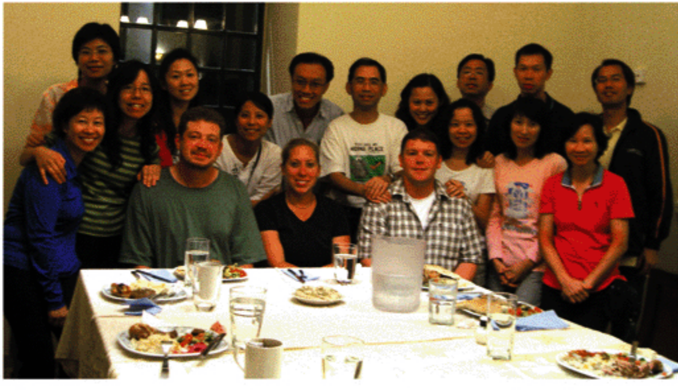
以色列訪宣隊與差會部份的猶太宣教士