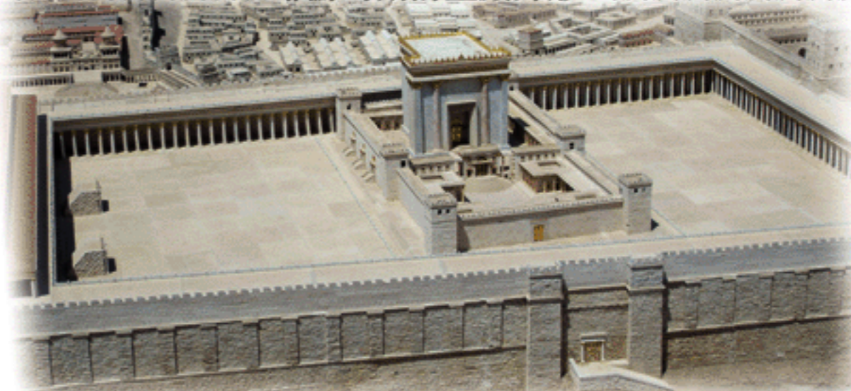
耶穌時期的聖殿外形

附：在今年的修殿節，差會宣教士照樣會把握機會，舉行節期的聚會和活動，建立和猶太朋友的關係，並傳講神的信息。請禱告記念這些寶貴的福音機會。