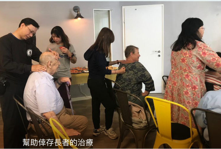
幫助倖存長者的治療