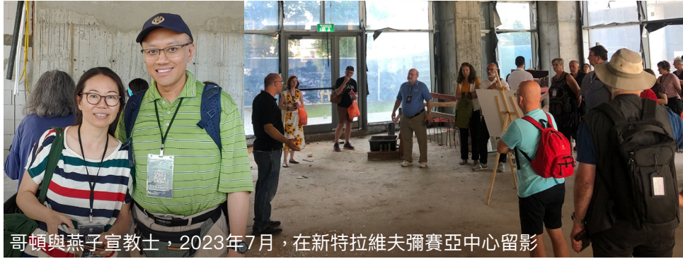
哥頓與燕子宣教師，2023年7月，在新特拉維夫彌賽亞中心留影