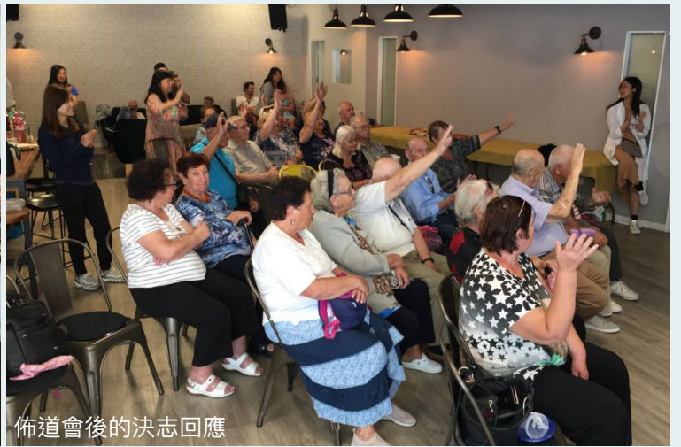
佈道會後的決志回應